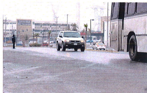
Se instaló concreto hidráulico para garantizar mayor duración del pavimento.