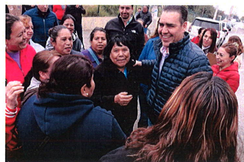
La gente se mostró contenta por las obras realizadas en sus colonias.

el pavimento de la avenida y en el acceso principal de la colonia antes mencionada. E